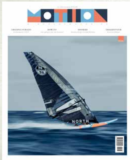
MOTION WINDSURF MAGAZINE 2 uitgaven per jaar motionwindsurfmagazine.nl