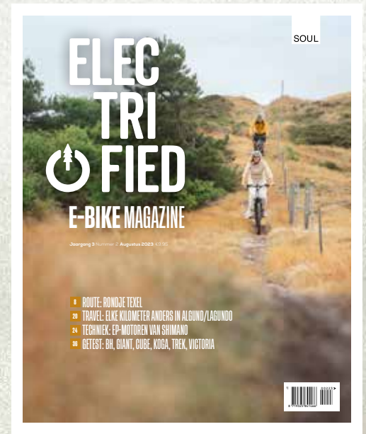
ELECTRIFIED E-BIKE MAGAZINE 3 uitgaven per jaar ridersguide.nl/electrifiedebikemagazine/