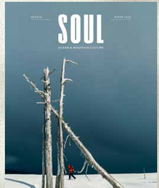
SOUL MAGAZINE 2 uitgaven per jaar soulmagazine.nl