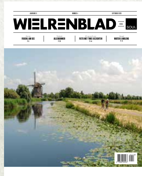
WIELREBLAD 6 uitgaven per jaar wielrenblad.nl