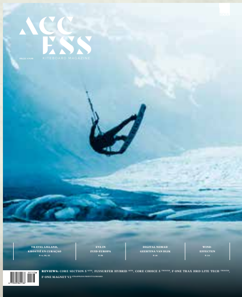
ACCESS KITEBOARD MAGAZINE 5 uitgaven per jaar acceskiteboardmagazine.nl