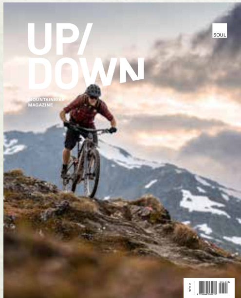
UP/DOWN MOUNTAINBIKE MAGAZINE 6 uitgaven per jaar mountainbikemagazine.nl

For English: send an e-mail to: marketing@hicle-events.com