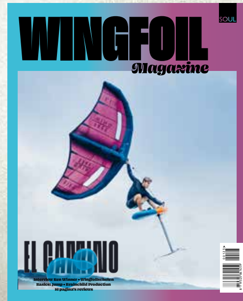
WINGFOIL MAGAZINE 2 uitgaven per jaar ridersguide.nl/wingfoilmagazine/